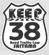
道路交通法第38条 「横断歩道における歩行者等の優先」