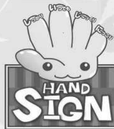
道路横断時の安全行動 イメージキャラクター 「サイン(SIGN)ちゃん」