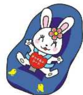
チャイルドシート着用推進 シンボルマーク「カチャビヨン」